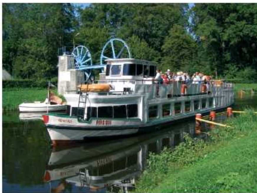
Statek na Kanale Elbląskim.