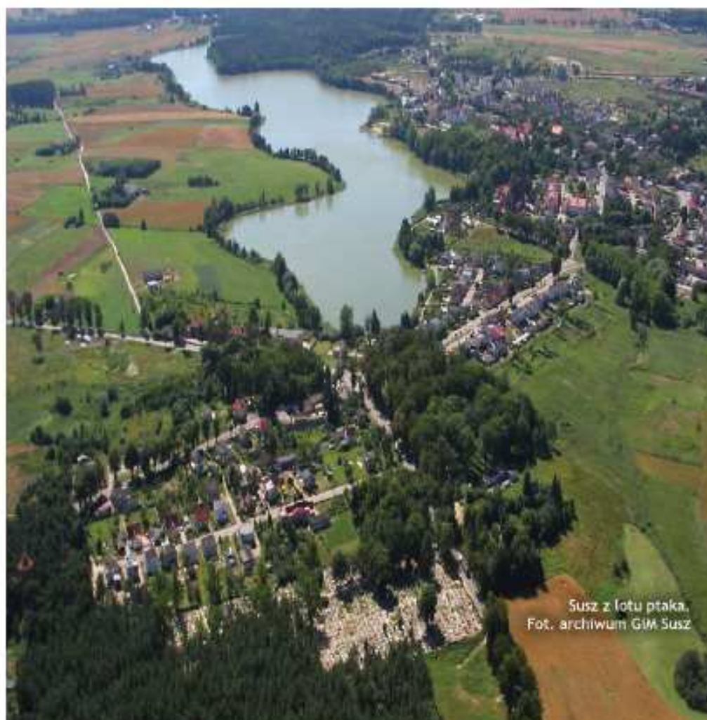
Susz z lotu ptaka.

Pałac w Kamieńcu (1720r.) - zwany również wschodniopruskim Wersalem czy Wersalem Królestwa Pruskiego ze względu na urodę, przepych, bogaty wystrój wnętrz oraz wspaniałe ogrody i otaczający park. Pałac zbudowany został przez magnacki ród Fickensteinów w stylu francuskiego baroku. Architektem obiektu (według jednych