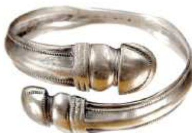
Wekllice - bransoletki żmijowata.

Stowarzyszenie Łączy Nas Kanal Elbląski Lokalna Grupa Działania w Elblągu ul. Jana Amosa Komeńskiego 40 Tel. 048 55 239-49-61, fax 048 55 643-58-45 e-mail: biuro@kanal-elblaski-lgd.pl www.kanal-elblaski-lgd.pl