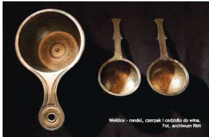
Weklice - rondel, czerpak i cedzidło do wina.

Niezwykłą atrakcją dla turystów jest rejs Kanałem Elbląskim z Elbląga do Ostródy. W trakcie tego rejsu statki płyną po trawie, pokonując około 100 metrową różnicę poziomów wody na długości około 10 km. Możliwe jest to dzięki unikalnym w skali światowej pochylniom w Catunach, Jeleniach, Oleśnicy, Kątach i Buczyńcu.