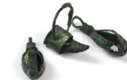
Weklice - amulety.