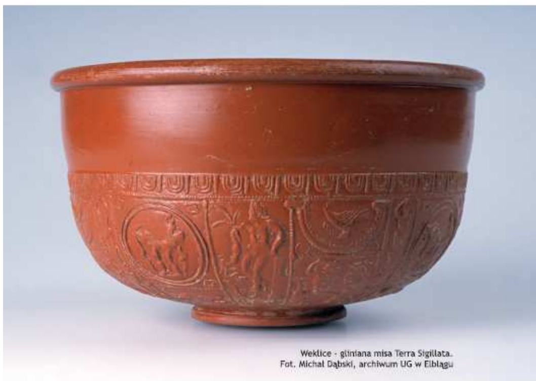
Weklice - gliniana misa Terra Sigillata.

Do dyspozycji gości: miejsce na namioty, ognisko, 3 rowery, sprzęt do koszykówki, piaskownica dla dzieci.