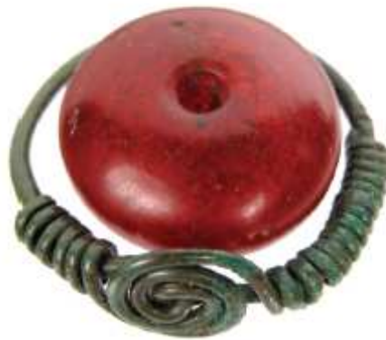
Weklice - paciór z pierścieniem magicznym.