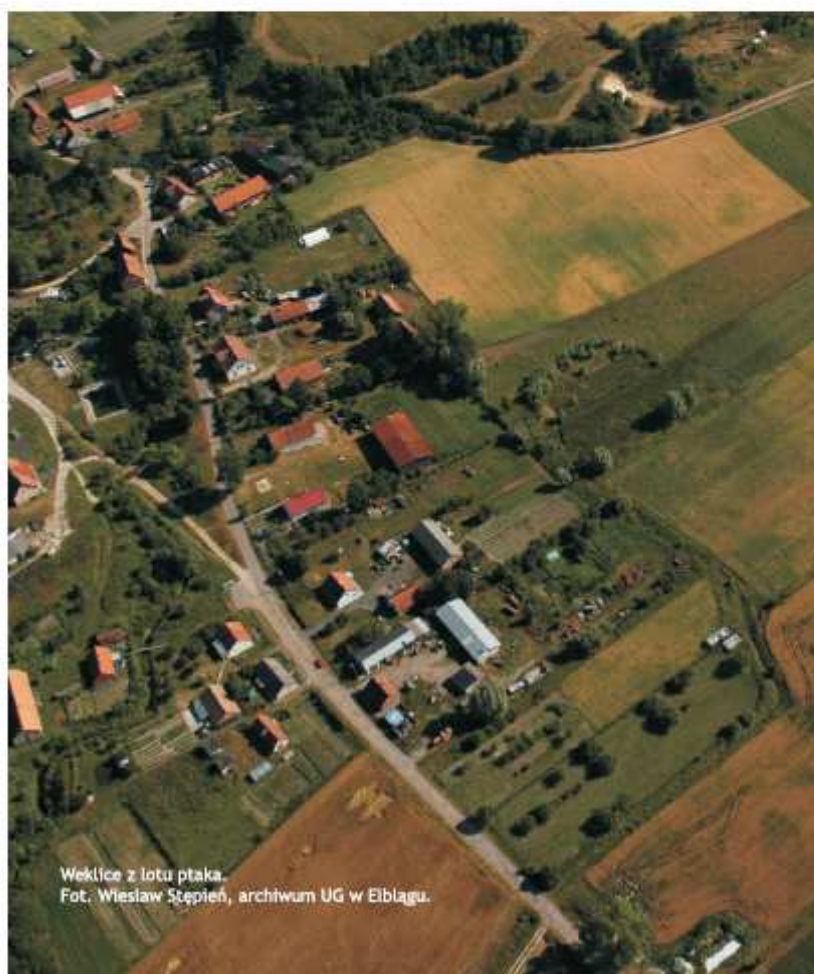
Weklice z lotu ptaka.

Weklice liczą 112 mieszkańców, powierzchnia wynosi 318 ha.