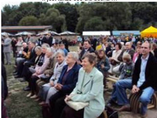
... i spotkanie znajomych ...