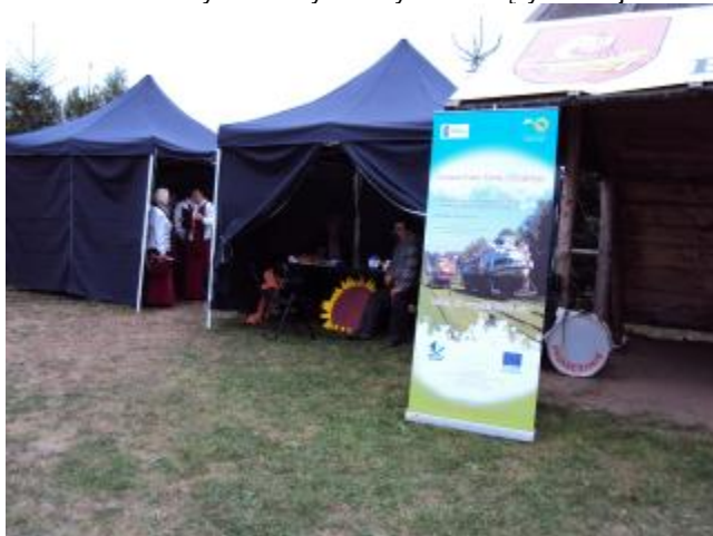
... przygotowania do występów zespołów ludowych ...