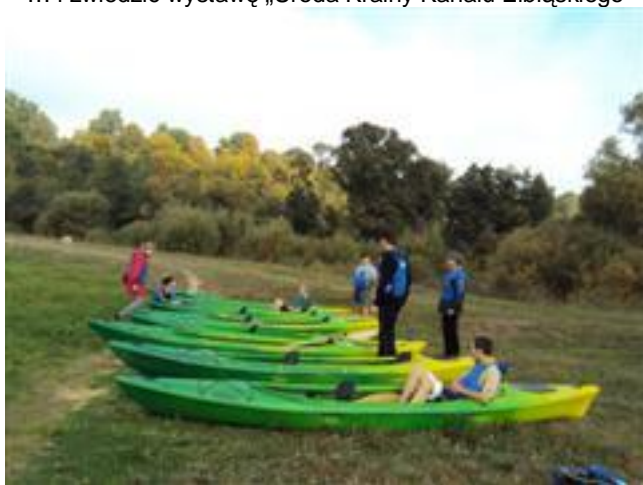
.. kajakarze przed startem ...