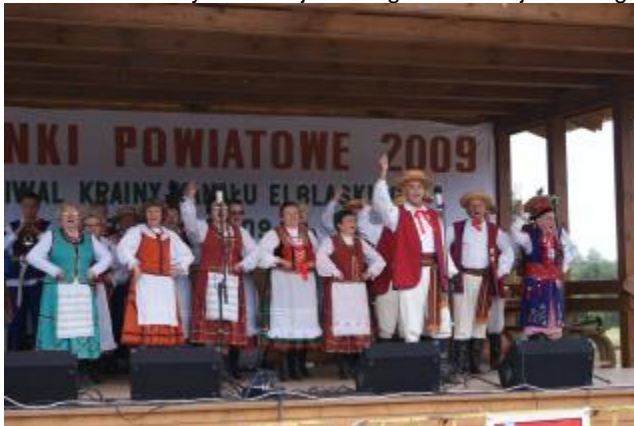
Zespół „Pasłęczanie” na scenie ..