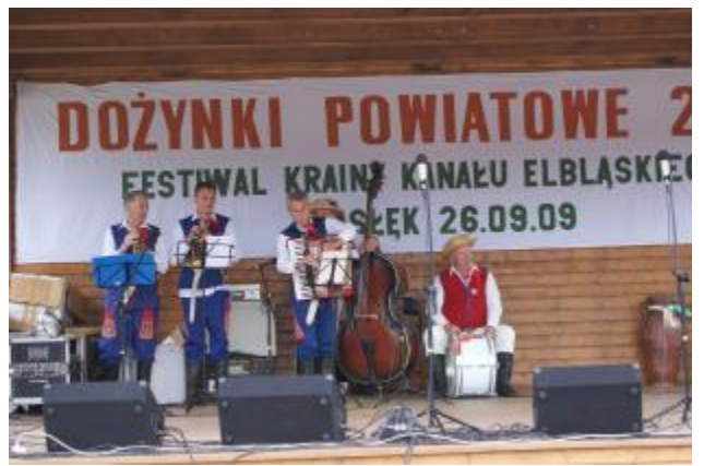
Przygotowanie do występu zespołu „Pasłęczanie”