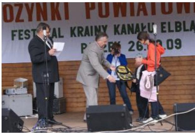
Podsumowanie wyników Rajdu – nagroda dla najmłodszego