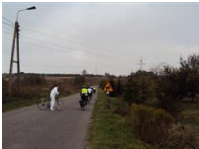
... zawsze można w drodze dołączyć do grupy ...