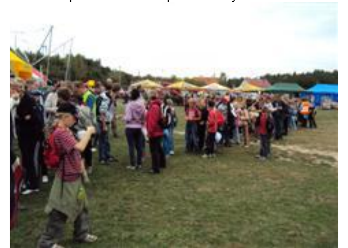
... w kolejce po grochówkę i kielbaski ...