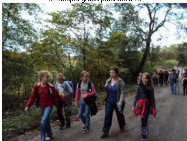
.....iść, ciągle iść, iść przed siebie ..