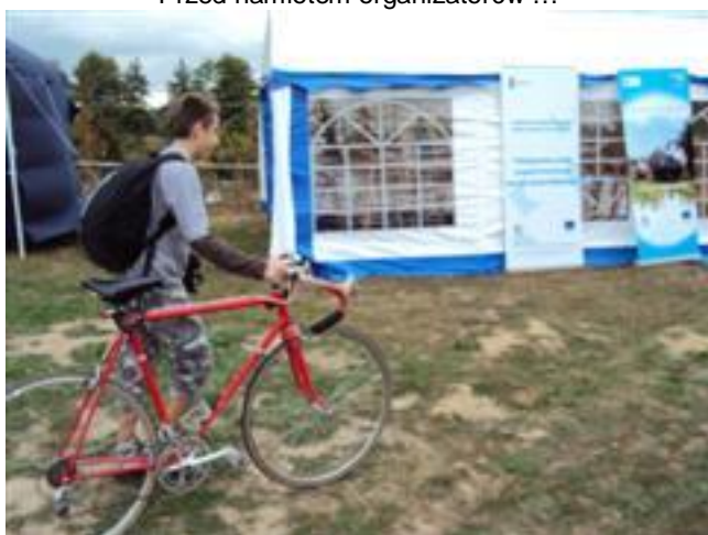
... i zwiedzić wystawę „Uroda Krainy Kanału Elbląskiego”