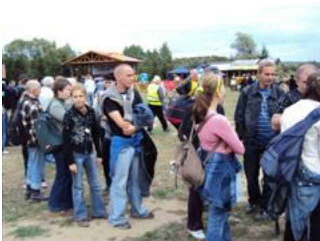
... nie dla wszystkich wystarczyło siedzących miejsc ...