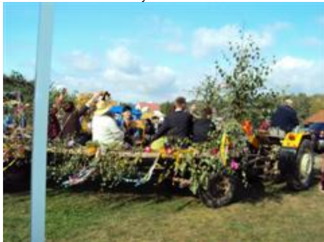
.. wjazd uczestników Biesiady z humorem i fantazją ...