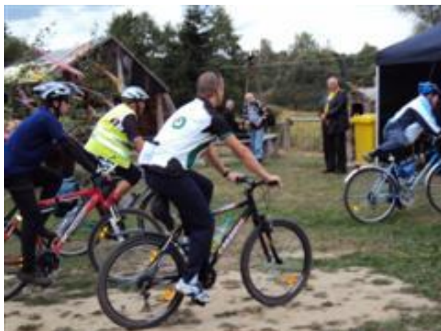
Przyjazd do Namiotu organizatorów ...