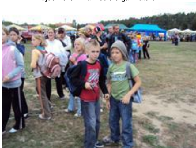
.... mimo czekania na posiłek, chyba dobre humory ...