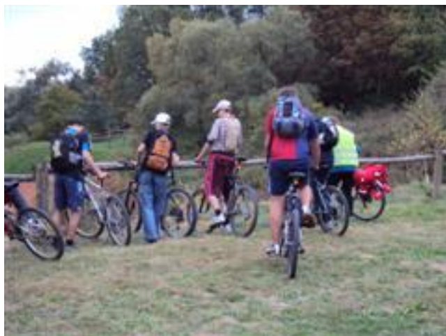
I po rajdzie ....