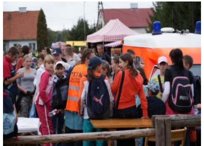
... potrzebna komuś pomoc medyczna ????