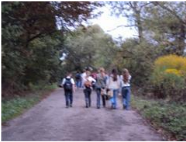
... już blisko do mety ...