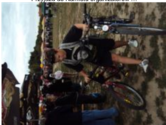
Jeszcze tylko odprowadzić rowery ...