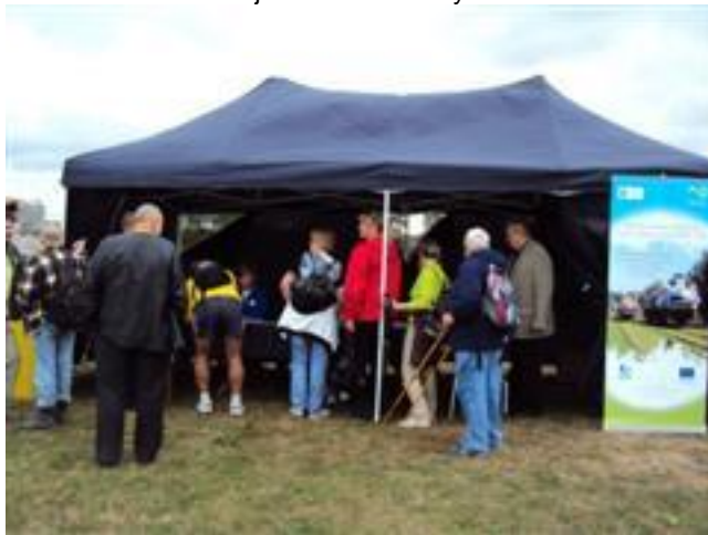
.... rajdowicze w namiocie organizatorów ....