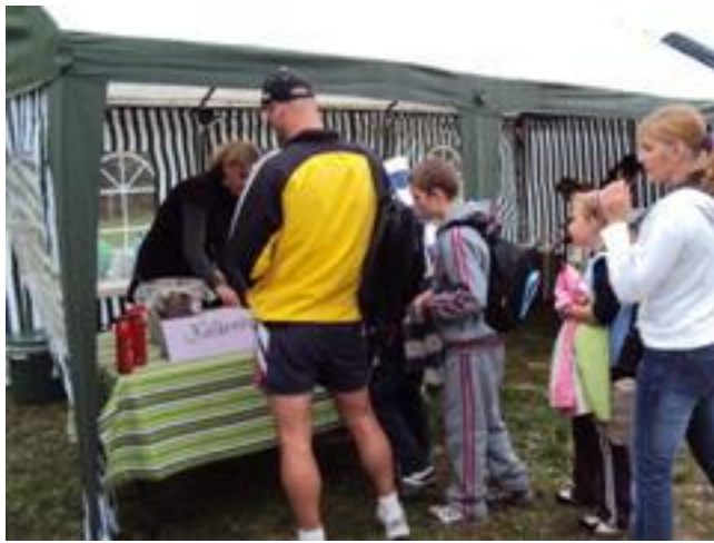
.. sprawna obsługa i smaczny posiłek ..