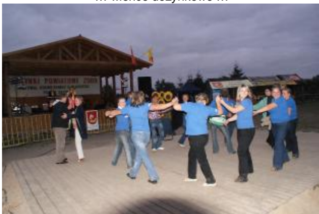
... zabawa w rytm greckiej muzyki