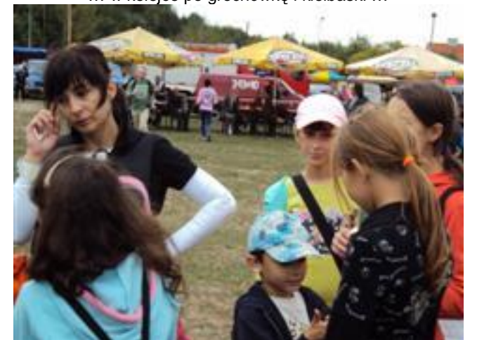
... głodni ?