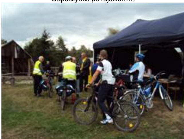
Przed namiotem organizatorów ...