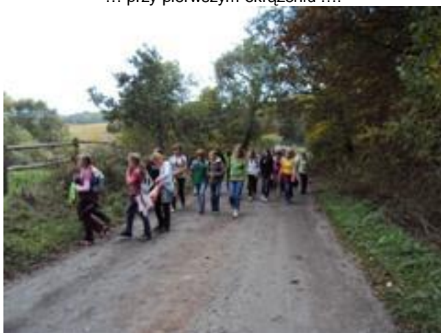
... nie ma jak piechurzy ...