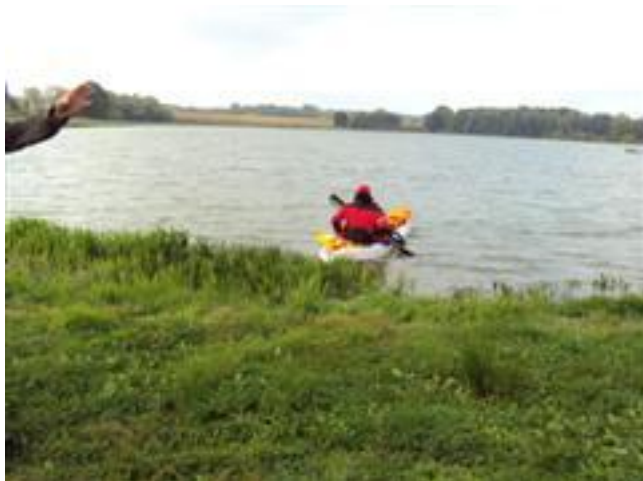
Ratownicy zabezpieczają spływ kajakowy na Zakrzewku II