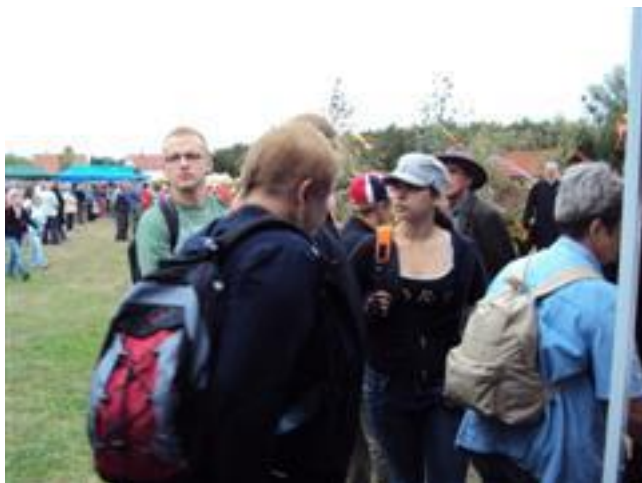
... nie dla wszystkich wystarczyło siedzących miejsc ...