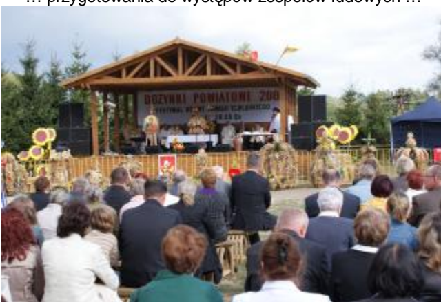
.. Festiwalowi towarzyszyły Dożynki Powiatowe ...