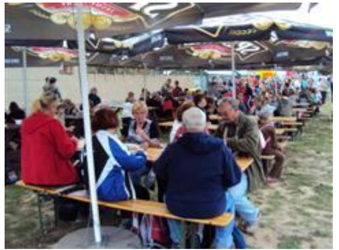
... nikt nie grymasi przy jedzeniu ???