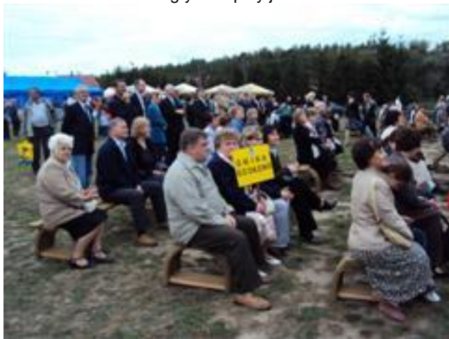
.. jest także coś dla ducha ...