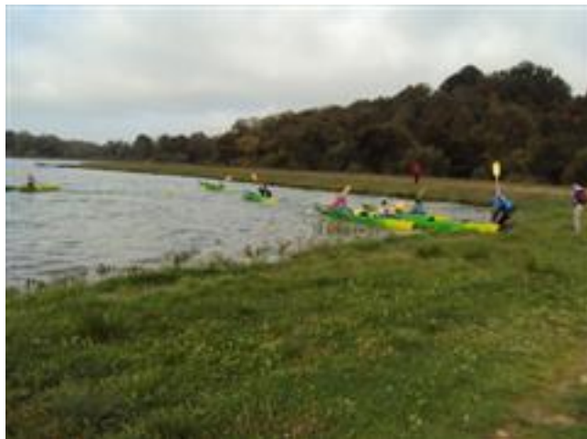
... i wystartowali ....