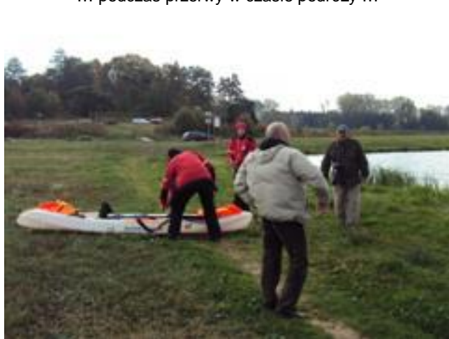
... przygotowania ratowników ...