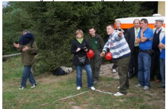
Jedną z atrakcji Festiwalu był rzut beretem burmistrza ...