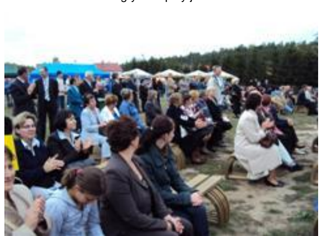
... można odpocząć i posłuchać muzyki ...