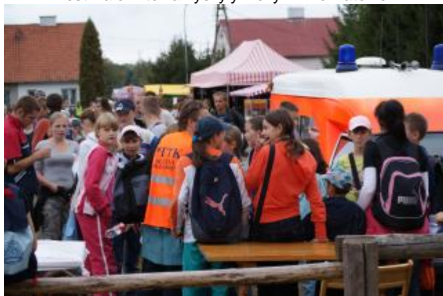
.. byle tylko było na czymś przycupnąć ...