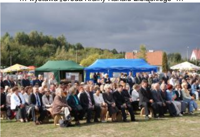
.. Festiwalowi towarzyszyły Dożynki Powiatowe ...