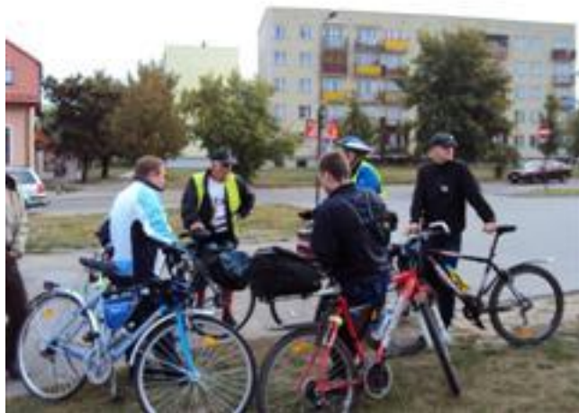
Przygotowania do rajdu rowerowego, Pastek