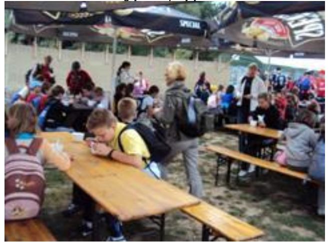
... nikt nie grymasi przy jedzeniu ???