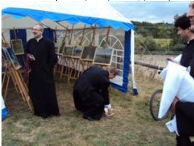
... wystawa „Uroda Krainy Kanału Elbląskiego” ...