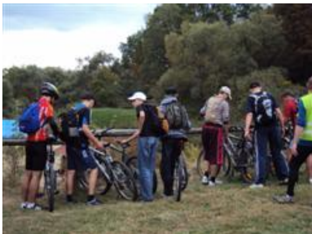
Odpoczynek po rajdzie.....