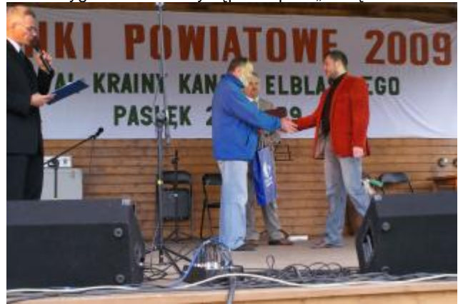
Nagrody w konkursie fotograficznym ..