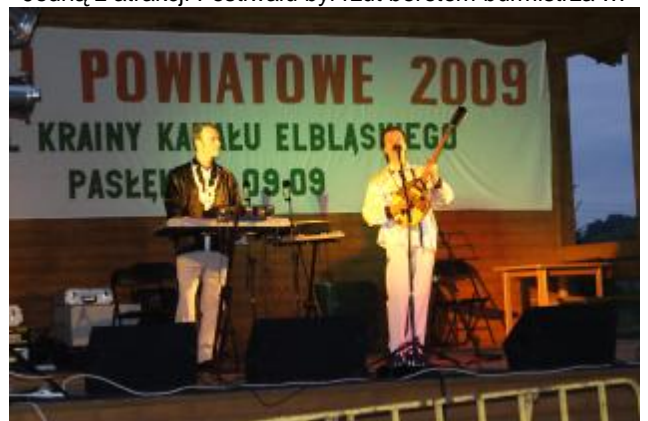
Greckie rytmy ...

Oprac. Stanisława Pańczuk Pasłek, 26 września 2009 roku.