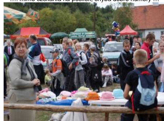
.... wszystko jedno gdzie, byle odpocząć ...