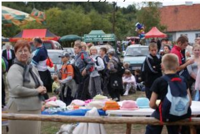
... i chwilę odpocząć ....