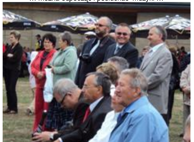
... Starosta i wicestarosta podczas Festiwalu ...