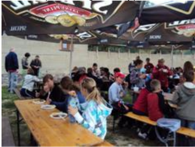
... nikt nie grymasi przy jedzeniu ???