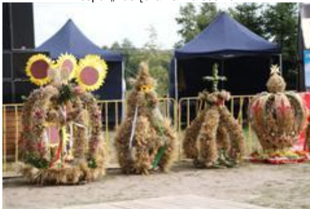
... wieńce dożynkowe ...