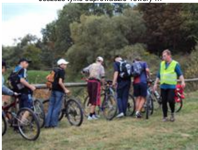
... podczas przerwy w czasie podróży ...