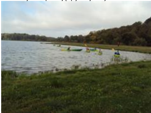
... przy pierwszym okrążeniu ....