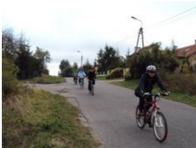
Już w trasie, Pastek w kierunku Marianki