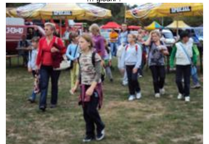
... już blisko do celu ...