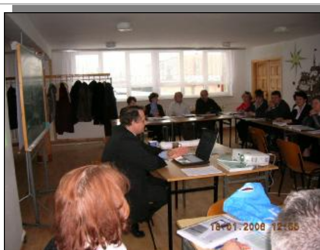
Druga grupa pracuje nad planami odnowy wsi .....