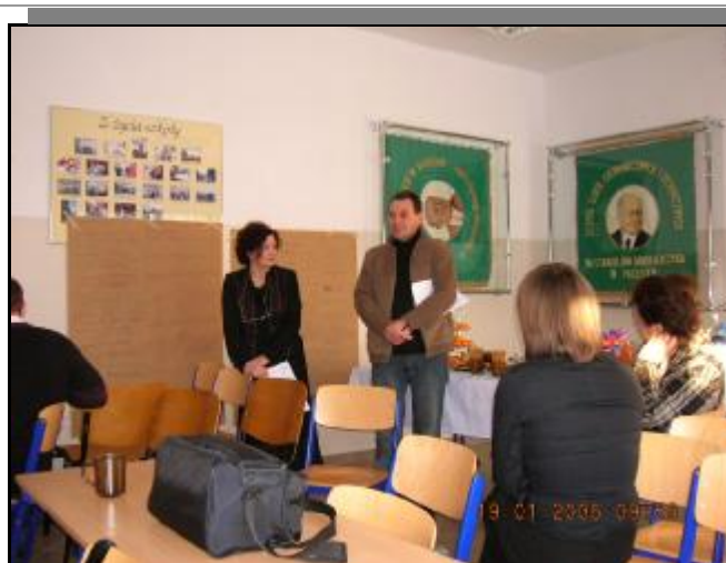
Gmina Maldyty prezentuje własne pomysły rozwojowe .....