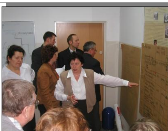
Została nawiązana współpraca międzygminna: Rychlik, Gronowa Elbląskiego, Pasłęka i Elbląga