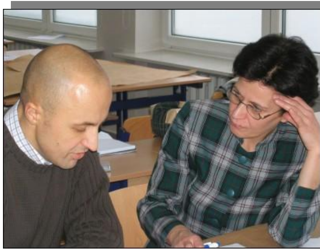
Praca wre, nad projektami pracują uczestnicy warsztatów z Gmin: Zalewo, Milomlyn, Hława, Pasłęk