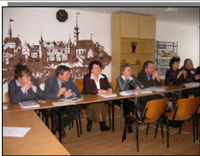
odnowa wsi c.d. ...