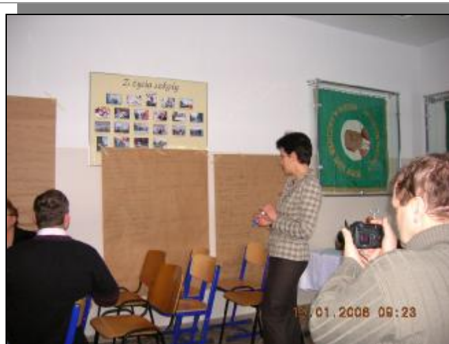
Przygotowania do prezentacji wyników prac zespołów gminnych: Miłomłyna i Pasłęka.....