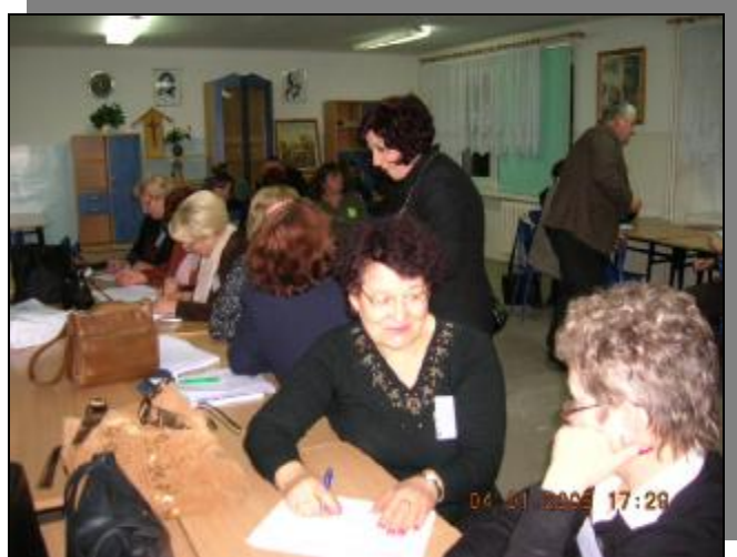
Grupa odnowy wsi z Gminy Susz i Elbląg