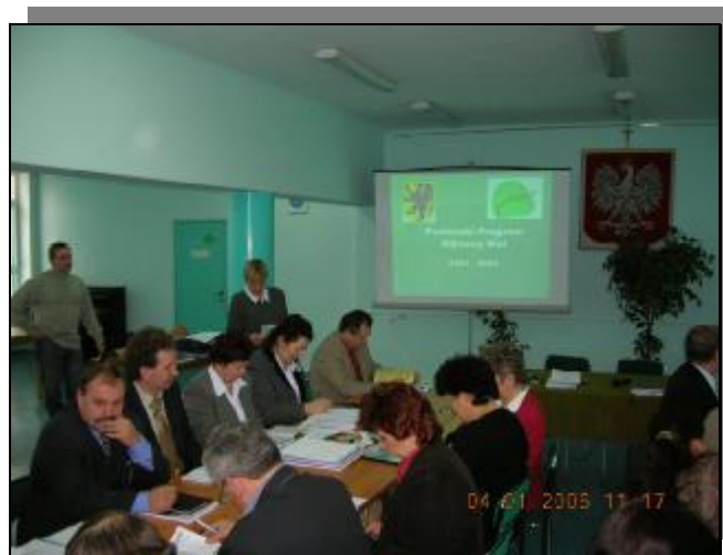
Otwarcie warsztatów 4 stycznia 2006 roku - Ryszard Zabłotny – Starosta Iławski