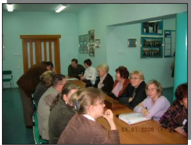
Grupa przygotowana do podsumowania warsztatów, .....