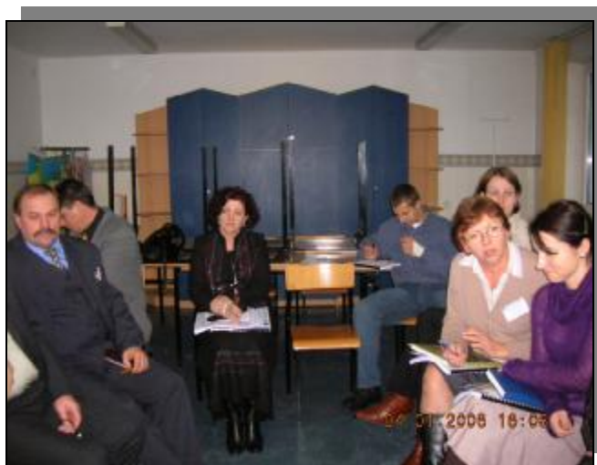
Warsztaty strategiczne – analiza SWOT