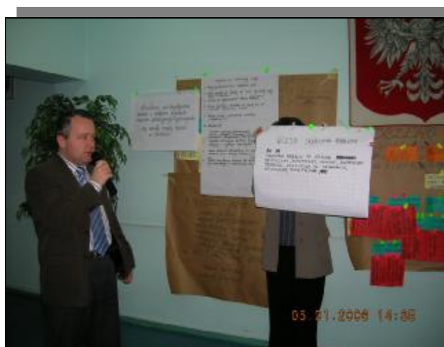
Podsumowanie drugiego dnia warsztatów – grupy odnowy wsi z Matyty, Markusy

W warsztatach strategicznych uczestniczyło: pierwszy dzień - 60 osób, drugi - 59 osób.