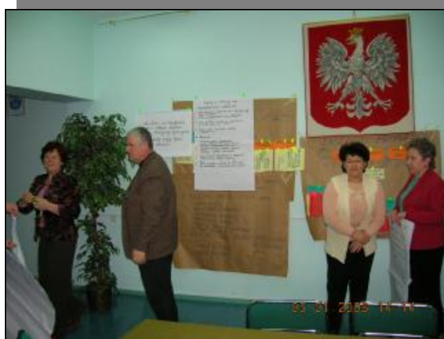
Podsumowanie drugiego dnia warsztatów – grupy odnowy wsi z Liksajn, Aniolowa, Wężyny