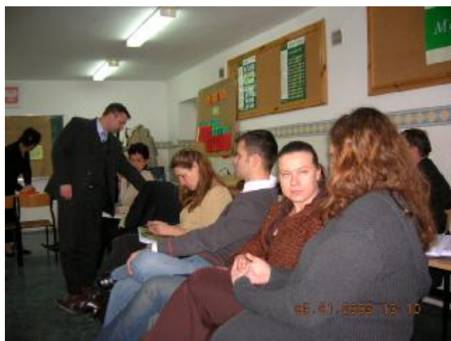
Drugi dzień warsztatów – analiza problemów i celów, misja i wizja....