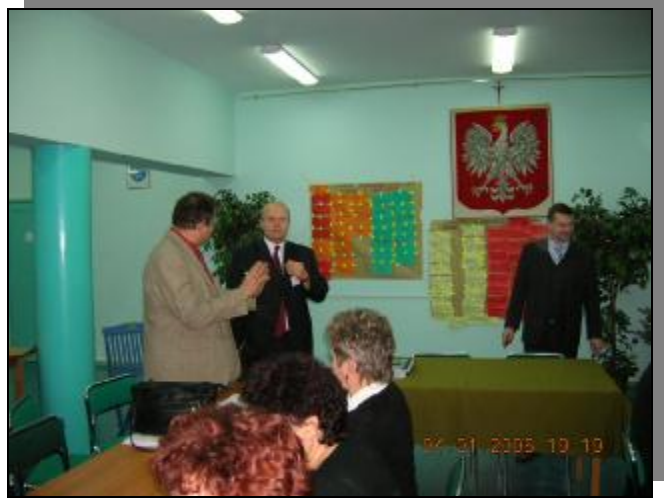
Podsumowanie pierwszego dnia warsztatów, .....