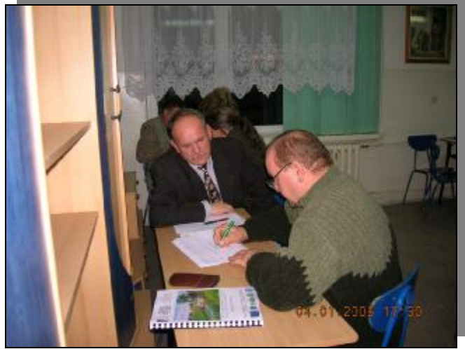
Grupa odnowy wsi z Gminy Miłomłyn i Rychliki