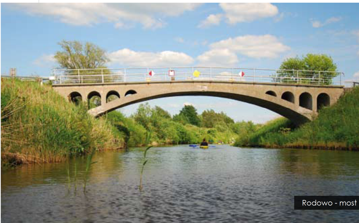
Rodowo - most